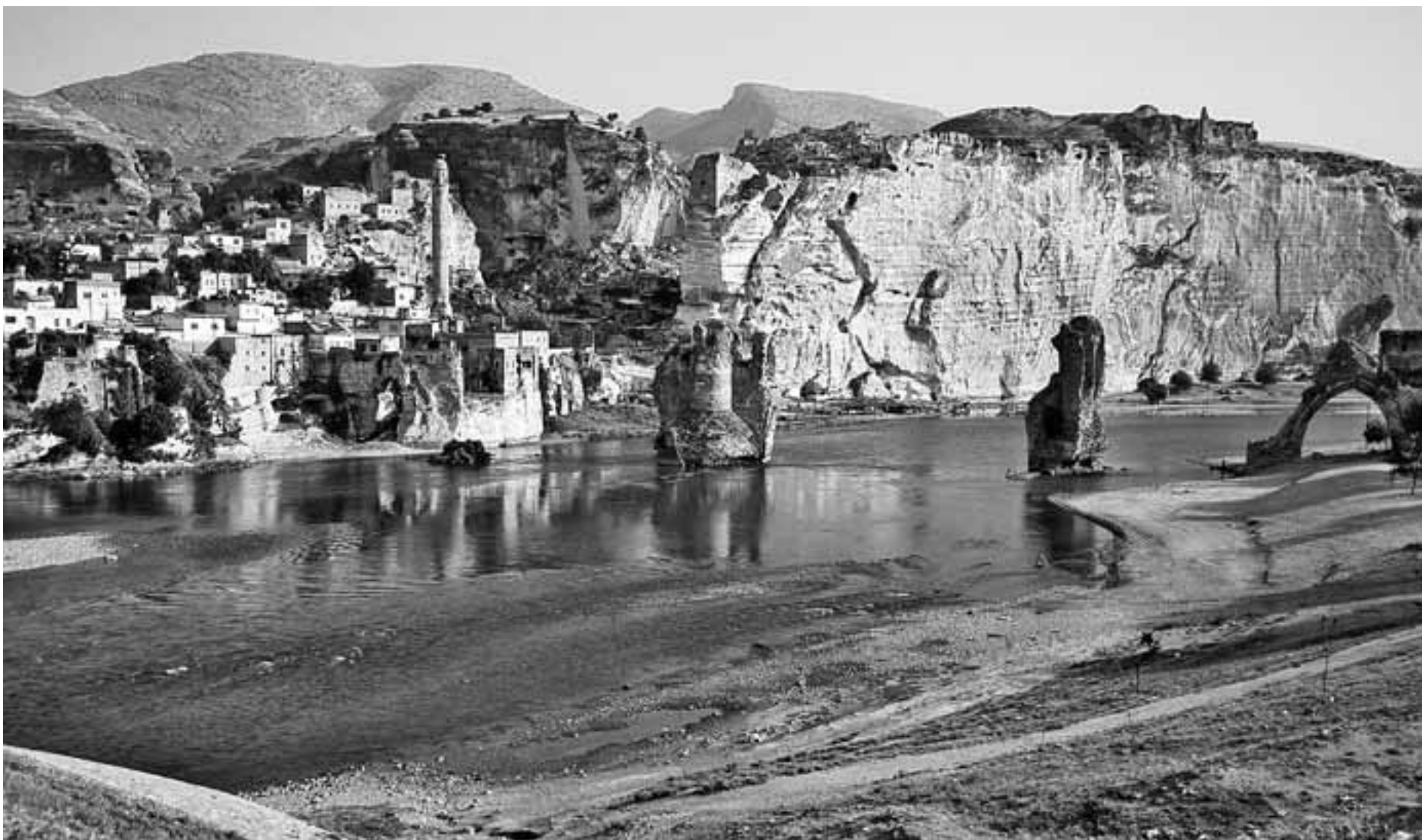
Vor uns die Sintflut. Bis zur Spitze des Minaretts von Hasankeyf soll das Wasser stehen. Die Ruinen der Seidenstraßen-Brücke werden dann verschwinden sein.

Tunceli hieß bis in die 30er Jahre hinein Dersim. Die Menschen sprechen einen eigenen kurdischen Dialekt, der bis in die 90er Jahre streng verboten war. Sie bekennen sich zum Alewitentum, einem Glauben, der islamische Einflüsse mit vorislamischen Elementen aus der Lehre des Zarathustra vereint. Kopftuchzwang und islamisches Recht lehnen die Alewiten ab, Frauen und Männer beten gemeinsam, Berge und Flüsse gelten als heilig.